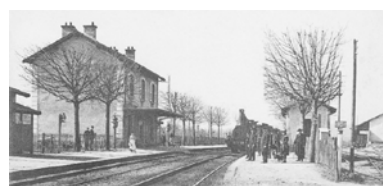
Exposition Voyage-voyage , Benjamin Grivot (2024), Le quai (294M9) aujourd'hui, Exposition L'albatros Jacqueline Gueux (2020), Exposition Point de côté Céline Cléron (2021), La gare avant Le quai (294M9) .